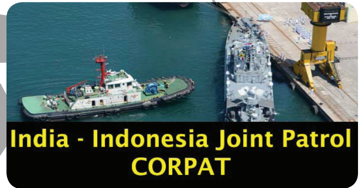
India - Indonesia Joint Patrol CORPAT